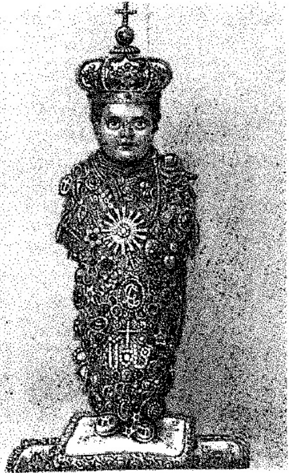
ROMA: il S. Bambino di Aracoeli

Tu voluntad pone en movimiento mi poder.