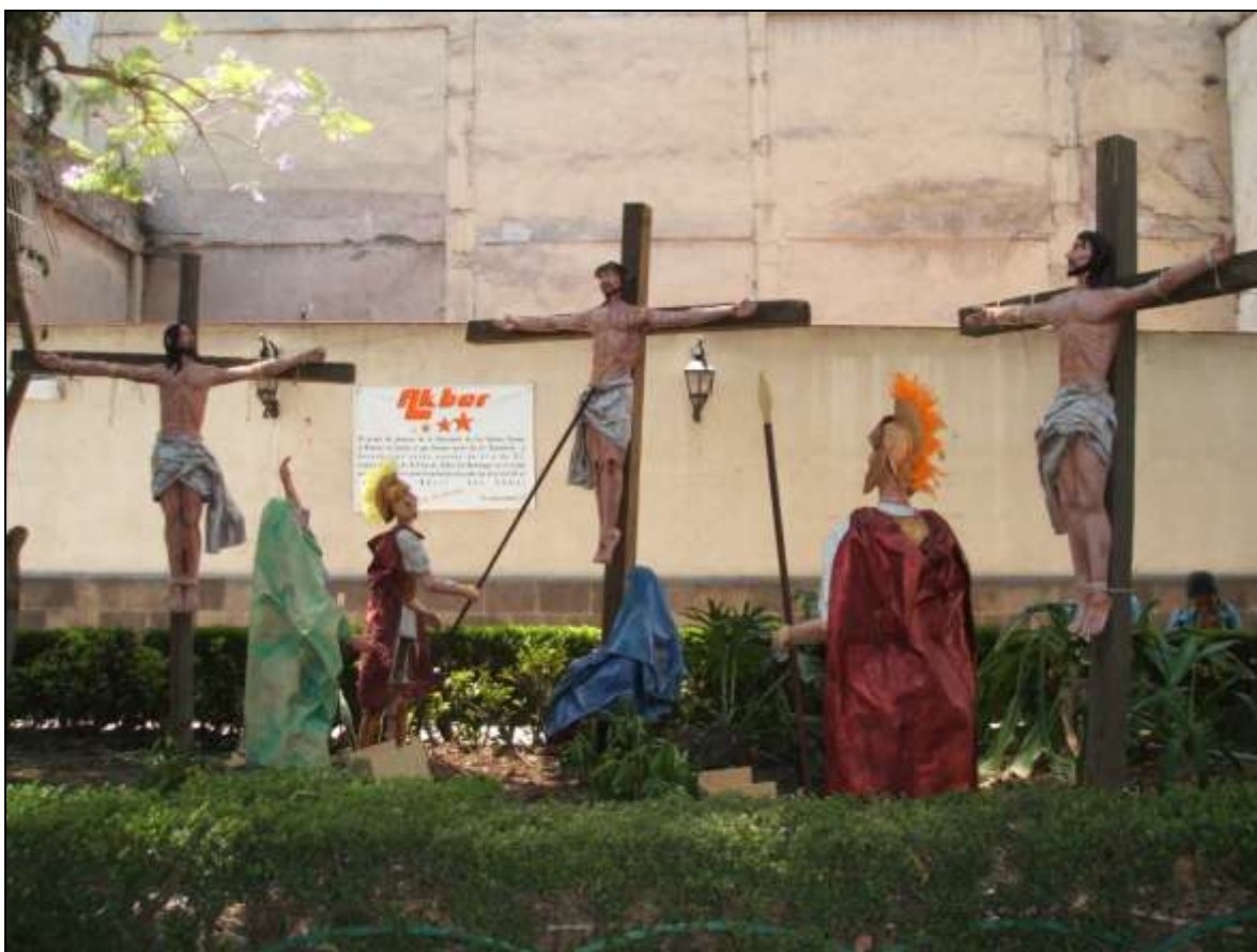
Calvario y escenas de la Pasión Parroquia de San Cosme